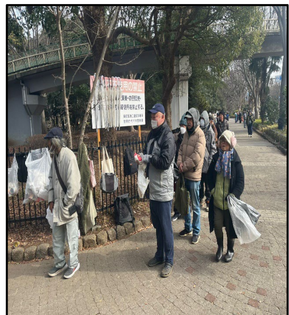
写真2-食料を受け取るホームレスの方々